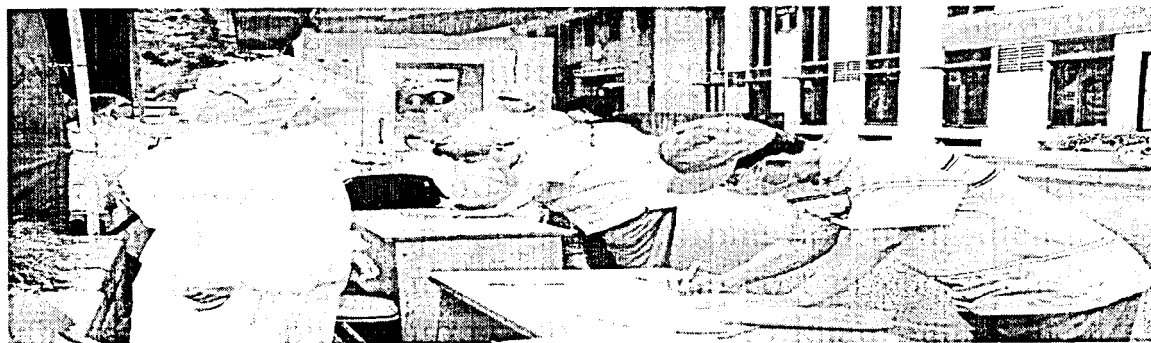
Khai báo y tế khi đến khám tại bệnh viện.

Việt Nam sẽ phải tiếp tục chống dịch COVID-19 trong thời gian dài và dần hình thành nếp sống, ứng xử phù hợp trong điều kiện có dịch bệnh; tiếp tục áp dụng các biện pháp cơ bản phòng chống dịch trong trạng thái "bình thường mới" như: đeo khẩu trang khi ra khỏi nhà, tại các nơi công cộng và trên các phương tiện giao thông công cộng; thường xuyên rửa tay bằng xà phòng hoặc dung dịch sát khuẩn; hạn chế tụ tập đông người ngoài phạm vi công sở, trường học, bệnh viện; giữ khoảng cách an toàn khi tiếp xúc.